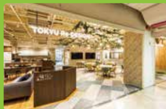
横浜市営地下鉄ブルーライン「中川駅」から徒歩2分 ハウスクエア横浜1F