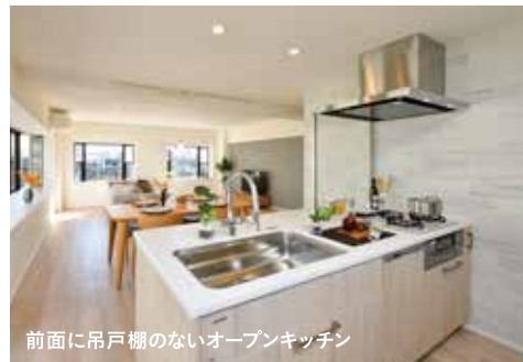
前面に吊戸棚のないオープンキッチン