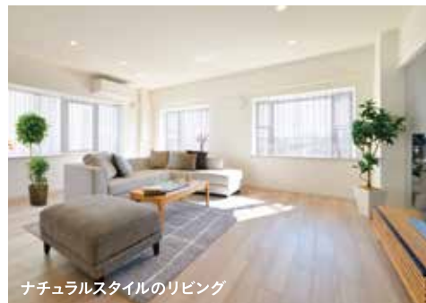
ナチュラルスタイルのリビング