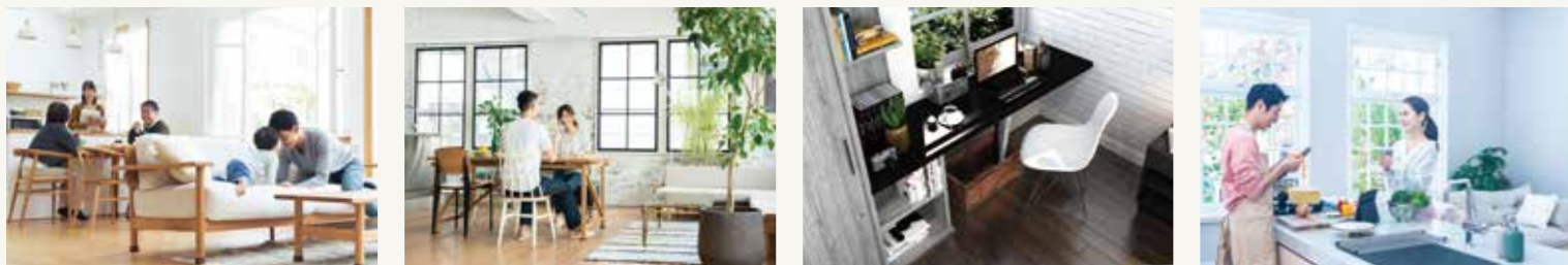
暮らしに合わせた間取り変更 一年中心地よい住まいに 新しい生活様式に合わせて 最新の水まわり設備に一新