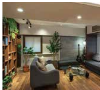
※写真は当社施工事例です。見学会場とは異なります。