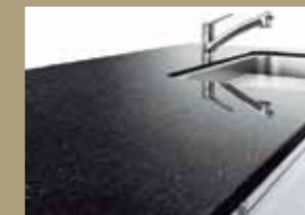
高級人造石ワークトップ