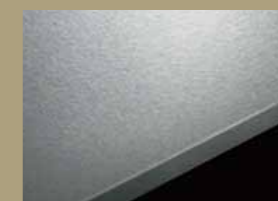
ステンレスパイプレーション加工