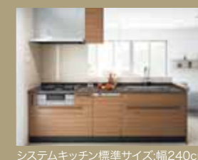
システムキッチン標準サイズ:幅240cm